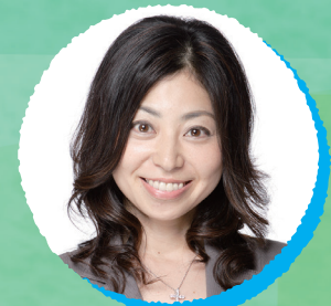
ナレーション 岡村 明美