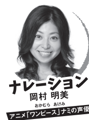
ナレーション 岡村 明美 おかむら あけみ アニメ「ワンピース」ナミの声優

東京アナウンスアカデミー卒業後に江崎プロダクション(現マウスプロモーション)付属養成所入所。1992年よりマウスプロモーションに所属。「紅の豚」(フィオ・ビッコロ)、「ONE PIECE」(ナミ)、「海月姫」(まやや)、「たまごっち!」(まきこ)、「ラブ★コン」(小泉リサ)をはじめ、数多くの有名作品に出演し、人気を博す。